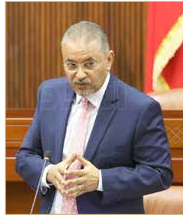
كبير المستشارين القانونيين

الحكومة تريد لها لسنة.. والنواب لثلاث.. والمعينون تعمدوا الاختلاف مع المنتخبين