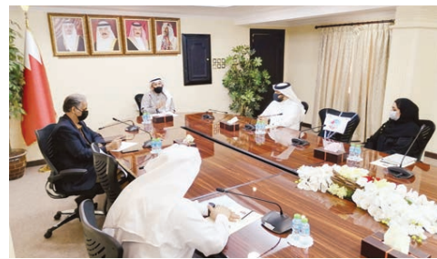
أشاد السيد علي بن الشيخ محافظ المحافظة الشمالية بالجهود التي يبذلها القائمون على معهد الإدارة العامة من أجل الإرتقاء بمستوى الكوادر الوطنية...