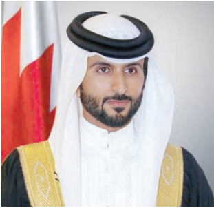
○ سمو الشيخ ناصر بن حمد.

المؤيد بعد الانتهاء من قمة الشباب والتي ستعقد على مدار يومين سيتم إعداد تقرير نهائي عن مجريات الجلسات تضمن التحديات التي تم مناقشتها والمقترحات والتوصيات التي طرحتها الشباب كمخرجات لتطبيقها لتجاوز التحديات في القطاعات المختلفة.