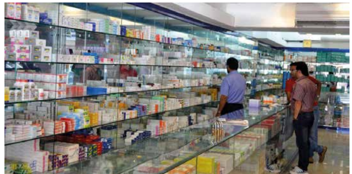
Pharmacies in Bahrain are under strict assessment, monitoring and auditing

The number of pharmaceutical products whose licenses were renewed by the Pharmaceutical Products Regulatory Department.