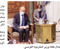
شيخ الأزهر خلال لقائه وزير الخارجية الفرنسي.

قال شيخ الأزهر المشكور أحمد الطيب، خلال لقائه وزير الخارجية الفرنسي جان إيف لورواين في القاهرة أمس الأحد، إن الإساءة إلى النبي محمد صروفوه تافها، مشددا أيضا على رفضه وصف الإرهاب بالإسلامي، وقال شيخ الأزهر، إننا كنا نعتبرون أن الإساءة إلى نبينا محمد حجة تعبير عن برهنا شكلا ومضمونا، وأضاف: «الإساءة لنبينا محمد برفوضه تافها، وسوف نتبع من يسه نيبنا الأكرم في المحاكم الدولية، حتى لو قضينا عرفنا تلك نكف تلك الأمر فقط. كما أعرب عن رفضه وصف الإرهاب بالإسلامي، قائلا: «نرفض وصف الإرهاب بالإسلامي، وليس لدينا وقت ولا رغبة للدخول في مصطلحات لا شأن لنا بها، وعلى الجميع وقف هذا المصطلح فوراً لأنه يجرح مشاعر المسلمين في العالم، إن مصطلح بنافي الحقيقة التي يعها الجميع، وتابع: «أوروبا مدينة لنبينا محمد ولبنينا، لما أنكته هذا الدين من نور للبشرية جمعاء، وتابع الطيب: «التجاوزات موجودة عند أتباع كل دين في شتى الأنظمة،