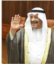
الرئيس علي الصالح

التقرير للجنة المختصة مرة أخرى "يريد الطين بلة".