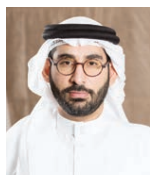
○ وزير الشباب والرياضة.

القرار باعتبارهم الحاضر وكل المستقبل وهم معنون تماما بكامل تفاصيل المستقبل للمملكة وصناعة القرار فيه. وبين وزير شؤون الشباب والرياضة: «تخفي قمة الشباب باهتمام من قبل صاحب السمو الملكي الأمير خليفة بن سلمان آل خليفة رئيس الوزراء وصاحب السمو الملكي الأمير سلمان بن حمد آل خليفة ولي العهد نائب القائد الأعلى النائب الأول لرئيس مجلس الوزراء باعتبارها تمثل جانبا من أولويات الحكومة التي نصرها تمكين الشباب وتأهيلهم وتوفير المقومات اللازمة لرفع مستوى مشاركتهم في صناعة القرار، وتوسيع دائرة إسهامهم في مختلف مسارات التطوير التي تشهدها المملكة. وتابع السيد أيمن بن توفيق