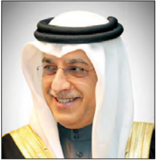
الشيخ سلمان بن إبراهيم

أشار الشيخ سلمان بن إبراهيم آل خليفة إلى أن الأمانة العامة للمجلس الأعلى للشباب والرياضة حرصت على تسخير مخرجات وتوصيات قمة الشباب 2018، وتحديث السياسات العامة للمجلس الأعلى للشباب والرياضة، مبيّنًا أنه سيتم الاستفادة من مخرجات القمة المقبلة في المضي قدمًا في عملية المراجعة والتحديث لتلك السياسات، والتي تركز على أهمية تعزيز الشراكة بين مختلف الأجهزة الحكومية في سبيل وضع الخطط والبرامج التي تلبي احتياجات الشباب، وتسهم في توجيه طاقاتهم التوجه السليم وتفعل إسهاماتهم في عملية التنمية الشاملة لمملكة البحرين.