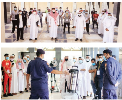
أقامت إدارة الأوقاف السنية ورشة تدريبية لعدد من مؤمني المساجد والمتطوعين في طرق تعقيم المساجد بالتعاون مع إدارة الدفاع المدني...